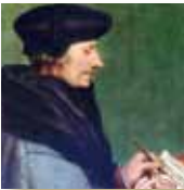
Porträt des Erasmus (1466 – 1536) von Hans Holbein dem Jüngeren (1523)

Der holländische Philologe und Philosoph Erasmus von Rotterdam war einer der bedeutendsten Repräsentanten des europäischen Humanismus. Er gilt als Vorreiter der Reformation, die er als Theologe durch seine kirchenkritische Haltung vorbereitete. Was liegt näher im Jahr der Reformation, als sein Denken und Werk vorzustellen, auch wenn er Luther niemals getroffen hat und ihre Auseinandersetzung medial erfolgte. Als Schüler von Jacob Obrecht war er musikalisch gebildet. Auch für das Kloster St. Peter blieb sein Schaffen nicht ohne Folgen. Die Satireschrift „Encomion Moriae“ gipfelt in dem Satz, dass die höchste Form des Glücks ein Leben mit einem gewissen Grad an Verrücktheit ist.