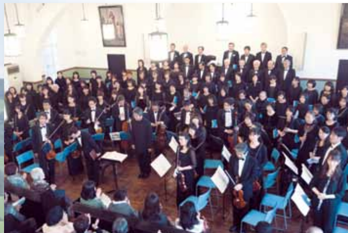
Osaka Bach Chor