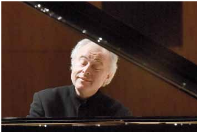
Sir Andrés Schiff

„Lieber Goldberg, spiele mir doch eine von meinen Variationen“, sagte Reichsgraf von Kayserlingk, russischer Gesandter in Dresden. Der Bach-Schüler Goldberg spielte dann aus einem der berühmtesten Werke der Musikgeschichte.